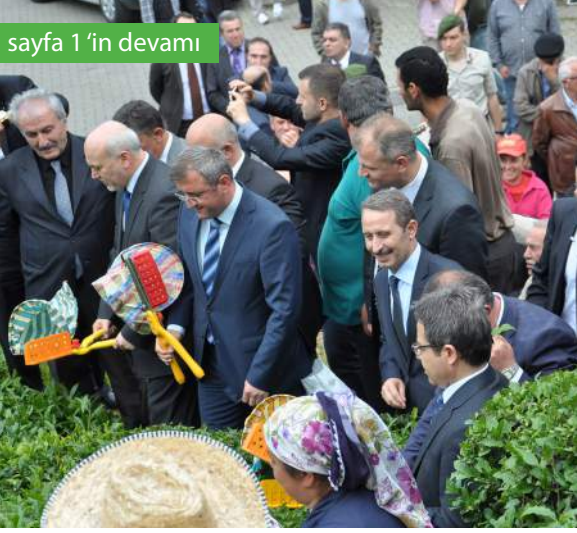
sayfa 1'in devamı