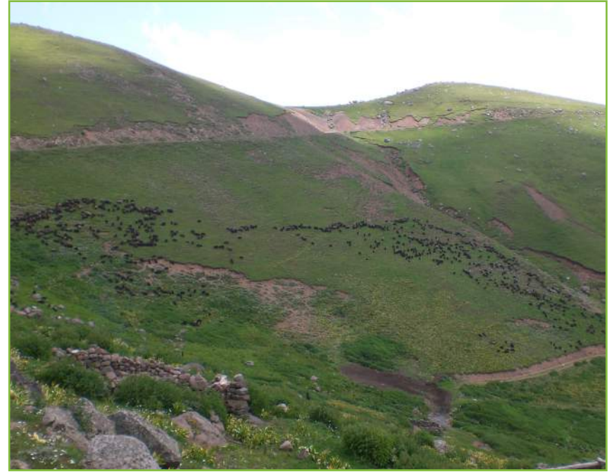
Et Mevdesi: Ot Mevdesidir...

Mera alanlarımızın bu özellikleri dikkate alındığında, ilimizde mera varlığı ihtiyacı karşılamaktan uzaktır. Bu da mera alanlarında yapılacak ıslah çalışmaları ve meraların korunmasının önemini artırmaktadır. Hayvancılığımız için vazgeçilmez olan meraların korunması ve sürdürülebilir şekilde hayvancılığın hizmetine sunulması için köy bazında otlatma planları hazırlanarak uygulamaya konulmalıdır. Alternatif kaba yem üretim kaynaklarının etkin ve sürdürülebilir şekilde devreye sokularak yem bitkisi ekilişlerinin artırılması önem arz etmektedir.